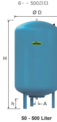
50 - 500 Liter