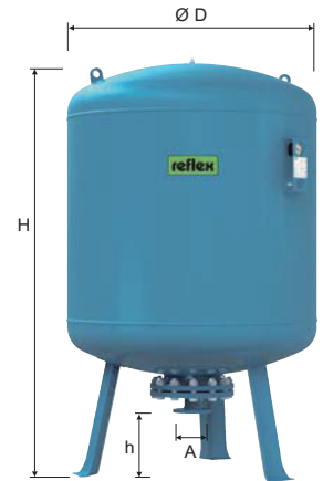
1000 (Ø 1000) - 2000 Liter