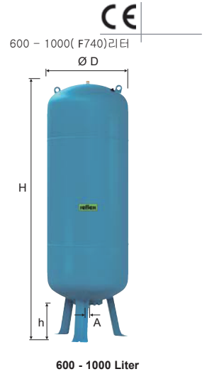
600 - 1000 Liter

mit Befestigungslaschen (Ansicht von hinten)