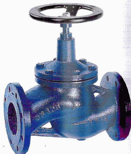
Verniciatura nitro BLU RAL 5013 Nitrocellulose painting BLUE RAL 5013

Bigger sizes Flanges with special drillings Chain-wheel for remote manoeuvre Pneumatic actuator S.A. or D.A. - electric actuator Padlock device Stellite overlay on seat and disc