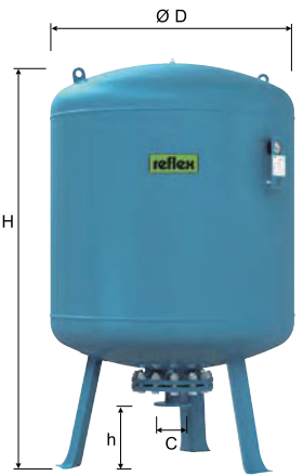
1000(Φ1000)- 2000 리터